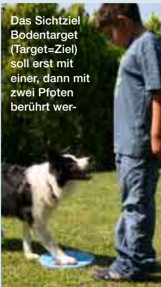
Das Sichtziel Bodentarget (Target=Ziel) soll erst mit einer, dann mit zwei Pfoten berührt wer-