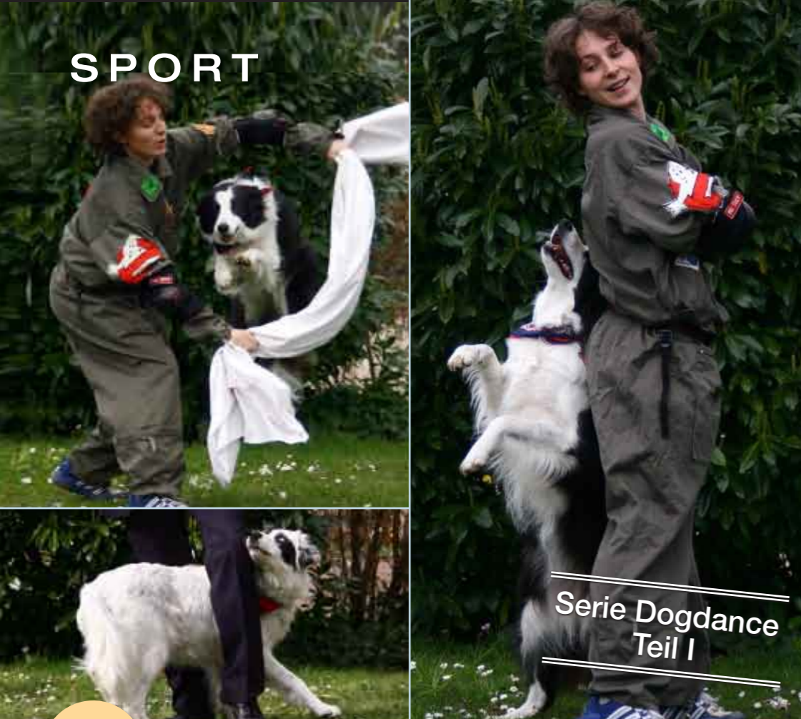
Serie Dogdance Teil I