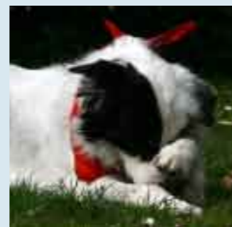
IM NÄCHSTEN HEFT Handtouch, Targetstick und Bodentarget

Normalerweise heißt es: „Aller Anfang ist schwer“. Beim Dogdance ist es genau umgekehrt: „Aller Anfang ist einfach“. Daher geht es im nächsten Heft auch schon gleich in die Vollen. Ich wünsche Ihnen jetzt schon viel Spaß beim Üben!